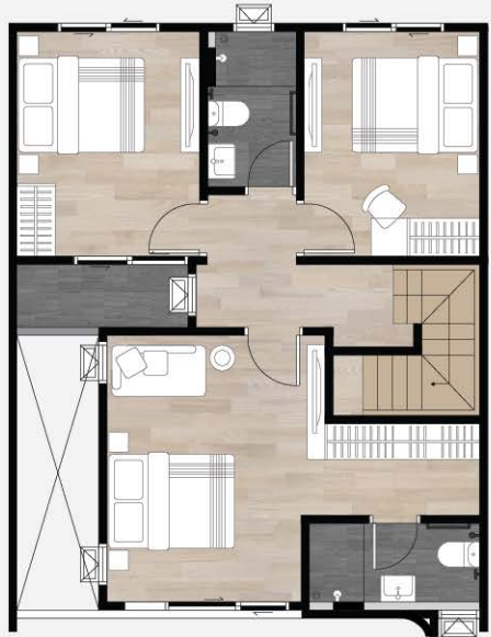
2ND FLOOR PLAN